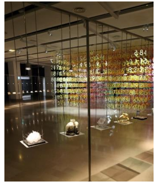
Vue d'expo Miniartextil 2018

Initiée en 1991 à Côme, l' exposition Miniartextil est devenue un événement de référence internationale, l'une des plus importantes expositions au monde consacrées à l'art textile contemporain. Elle est organisée par l'association Arte&Arte, qui a noué depuis maintenant 15 ans un étroit partenariat avec la Ville de Montrouge, qui ne cesse de s'étoffer. Chaque année, le jury de Miniartextil, présidé cette année par le créateur de mode Carlo Pozzoli et composé par l'artiste lettone Rolands Krutovs et le PDG Leclairteur Paris Micheal Hadida sélectionne une cinquantaine d'œuvres, à la croisée entre les nouvelles tendances de l'art contemporain, une tradition artisanale d'excellence et une nouvelle vague du design actuel.