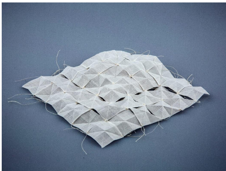
"Edge of madness" - Lidia Kuk

Du mercredi 7 au dimanche 25 février 2018