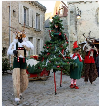
Oukile - spectacle 2015

En parallèle de l'installation lumineuse, et toujours dans l'esprit festif de Noël, Bercy Village propose des spectacles sous forme de déambulations de 30 minutes, animées par les compagnies Machtiern, Melba & compagnie et Le Père Noël des Palaces. Pour plonger les visiteurs encore plus dans la magie de Noël, ces animations féériques et entièrement gratuites sont prévues à partir du premier week-end de décembre . Peut-être croiserez-vous au détour d'une allée ces créatures étranges et mystérieuses qui arpenteront la Cour Saint-Emilion à la rencontre du public : du facétieux Arsène Lutin et ses fidèles comparses à une équipe très sportive de rennes athlétiques en passant bien entendu par le plus célèbre des barbous. Des spectacles et animations surprenants, avant ou après le traditionnel shopping de Noël et un bon chocolat chaud en terrasse (chauffée !).