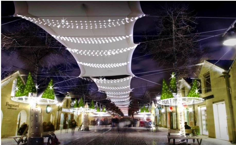
Magic Garden

Illuminations, déambulations et exposition 100% gratuites Programme complet sur www.bercyvillage.com